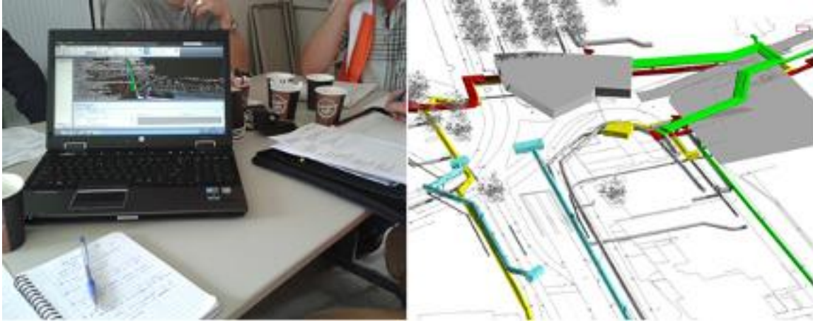
Figuur 1 - 4D model gebruikt tijdens vergadering project Toekomststraat (links) en schermafbeelding van 4D model Koningsplein

Naar aanleiding van ons onderzoek concludeerden we dat 4D-gebruikers: