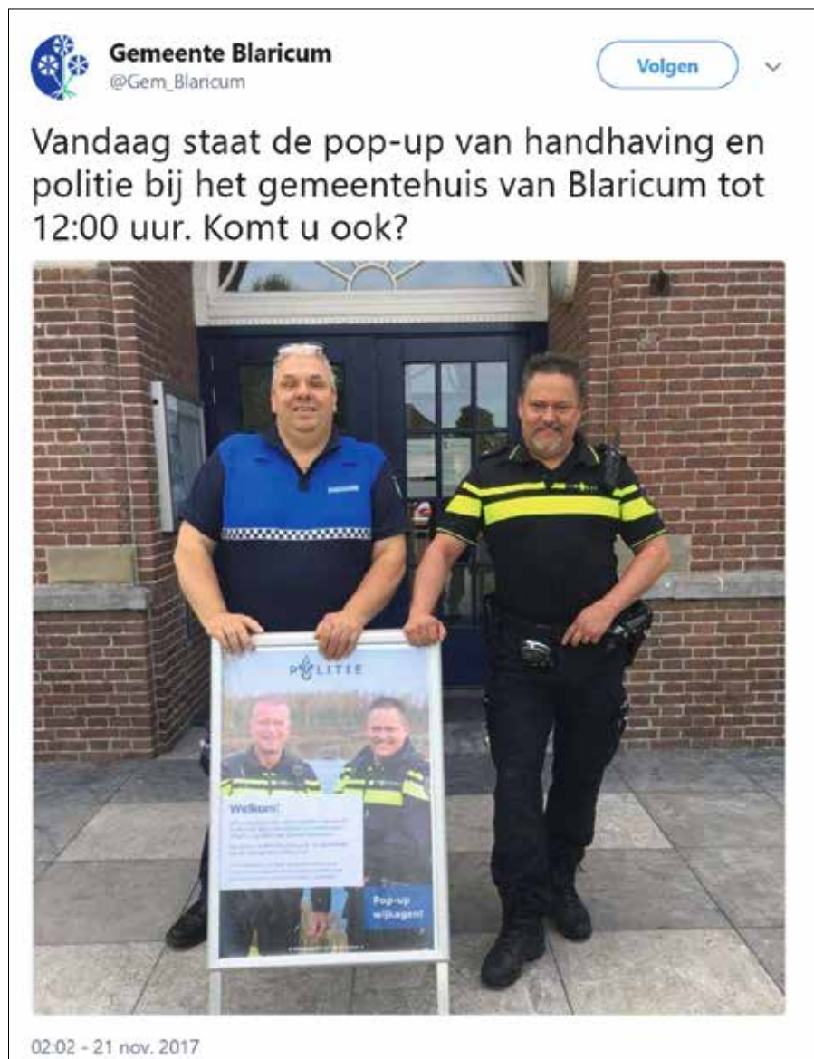
Er zijn inmiddels tientallen gemeenten in Nederland met een mobiele wijktafel of Pop-uppolitiebureau die online en offline contact tot stand brengen.

Emoties worden steeds vaker via sociale media gedeeld, waardoor een vonk kan overslaan op anderen (Kramer, Guillory & Hancock, 2014; De Vries et al., 2018). Zo werden heftige emoties losgemaakt door de opsporingsvideo van de ‘kopschoppers Eindhoven’. Hoewel de daders dankzij de hulp van een grote groep burgers in één dag werden opgespoord, kregen zij strafvermindering omdat hun privacy was geschaad. Hoewel de burgers waarschijnlijk in actie kwamen door de verspreide beelden, laat dit voorbeeld dus ook zien dat politie en Openbaar Ministerie in het contact met burgers een goede balans moeten zoeken tussen informatiewaarde en de rol van emoties. Inspeelen op emoties vereist een andere manier van communiceren dan alleen maar informeren en is ook lastiger omdat emoties niet overeen hoeven te komen met wat er feitelijk gaande is.