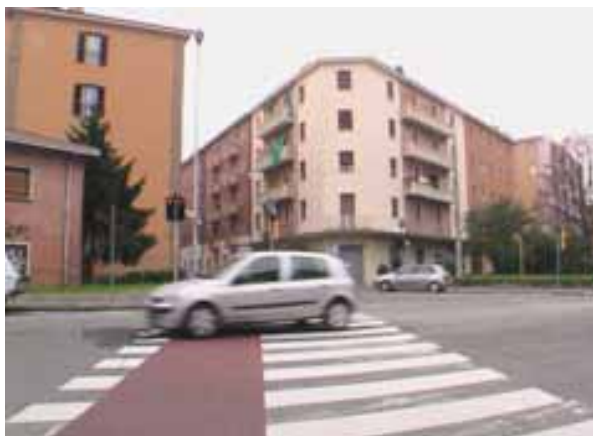
Fotografia n° 4