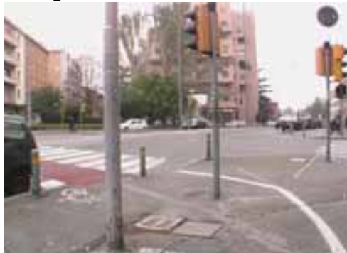
Fotografia n° 2