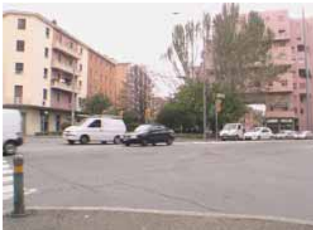
Fotografia n° 3