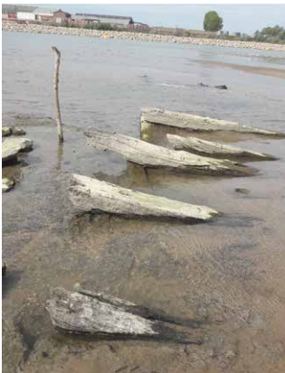
Beverburcht in aanbouw