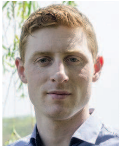
NICOLE SCHYNS STUDIO

»In Nederland was er onlangs een discussie over kinderarbeid in de textielindustrie. Als consument wil je uiteraard geen kleren kopen uit zulke fabrieken, maar uit welke winkels moet je dan wegblijven? Je voelt dat sommigen er belang bij hebben om