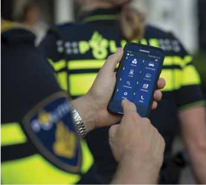
Figuur 3.4 MEOS