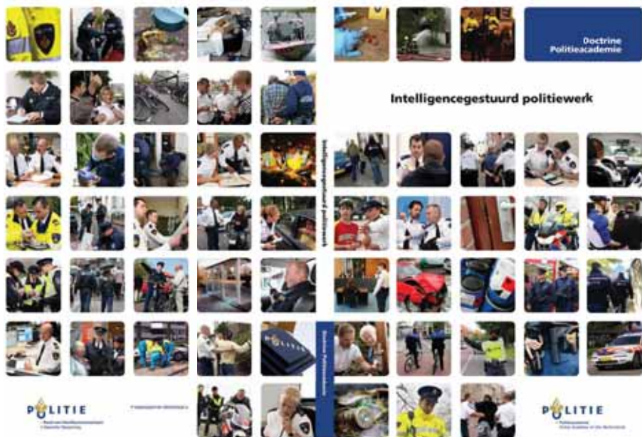
Figuur 3.3 Doctrines intelligencegestuurd politiewerk

opgesteld, op basis van het vierjaarlijks opgemaakte Nationaal Dreigingsbeeld (NDB). De briefing wordt bovendien in de vorming van de nationale politie als een van de strategische thema's benoemd.