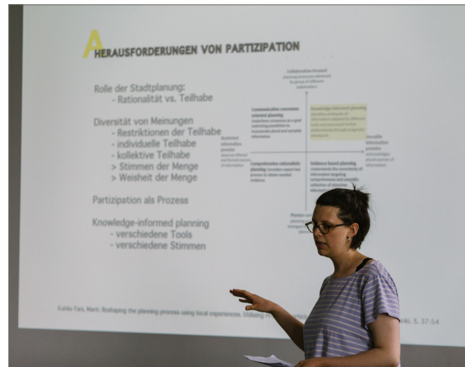
Abb. 2: Seminarsitzung zu digitalem Mapping und Partizipation in der Planung

Mit dem Boom um Smartphones und mobile Endgeräte seit den 2010er Jahren haben sich die Möglichkeiten der Erhebung von personenbezogenen und georeferenzierten Daten nochmals deutlich erweitert. Dies ist vor allem dem mobilen Internetzugang und der Integration von GPS-Empfängern und Kameras in diesen Geräten geschuldet. Vielfach wird nun