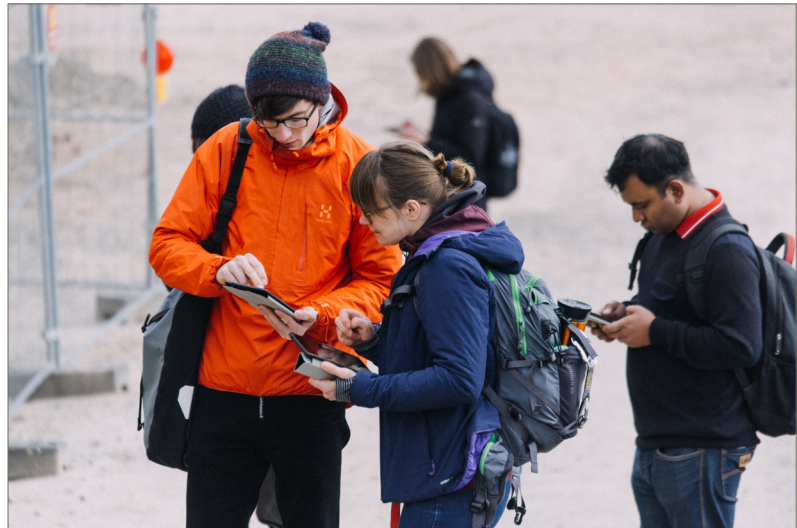
Abb. 3: Kollektives Kartieren auf dem Campus

Nach den genannten Beispiele ergeben sich nicht nur für die planerische Praxis und die raumbezogenen Wissenschaften neue Möglichkeiten, auch die Lehre für Studiengängen zur räumlichen Planung kann von dem Einsatz dieser Technologien durch die Erprobung in studentischen Forschungsprojekten und die Anwendung im Rahmen von Abschlussarbeiten profitieren. Bei Befragungen im Untersuchungsraum ist eine relativ präzise Georeferenzierung über den GPS-Sender des mobilen Endgeräts möglich und Daten können auch ohne Orts- und Kartografiekenntnisse seitens der Befragten abgerufen werden. Die intuitive und einfache Erhebung von raumbezogenen Daten sowie die Sichtbarmachung des eigenen Standorts eignen sich in didaktischer Hinsicht insbesondere zur Schulung von Raumwahrnehmung und Orientierungsverhalten.