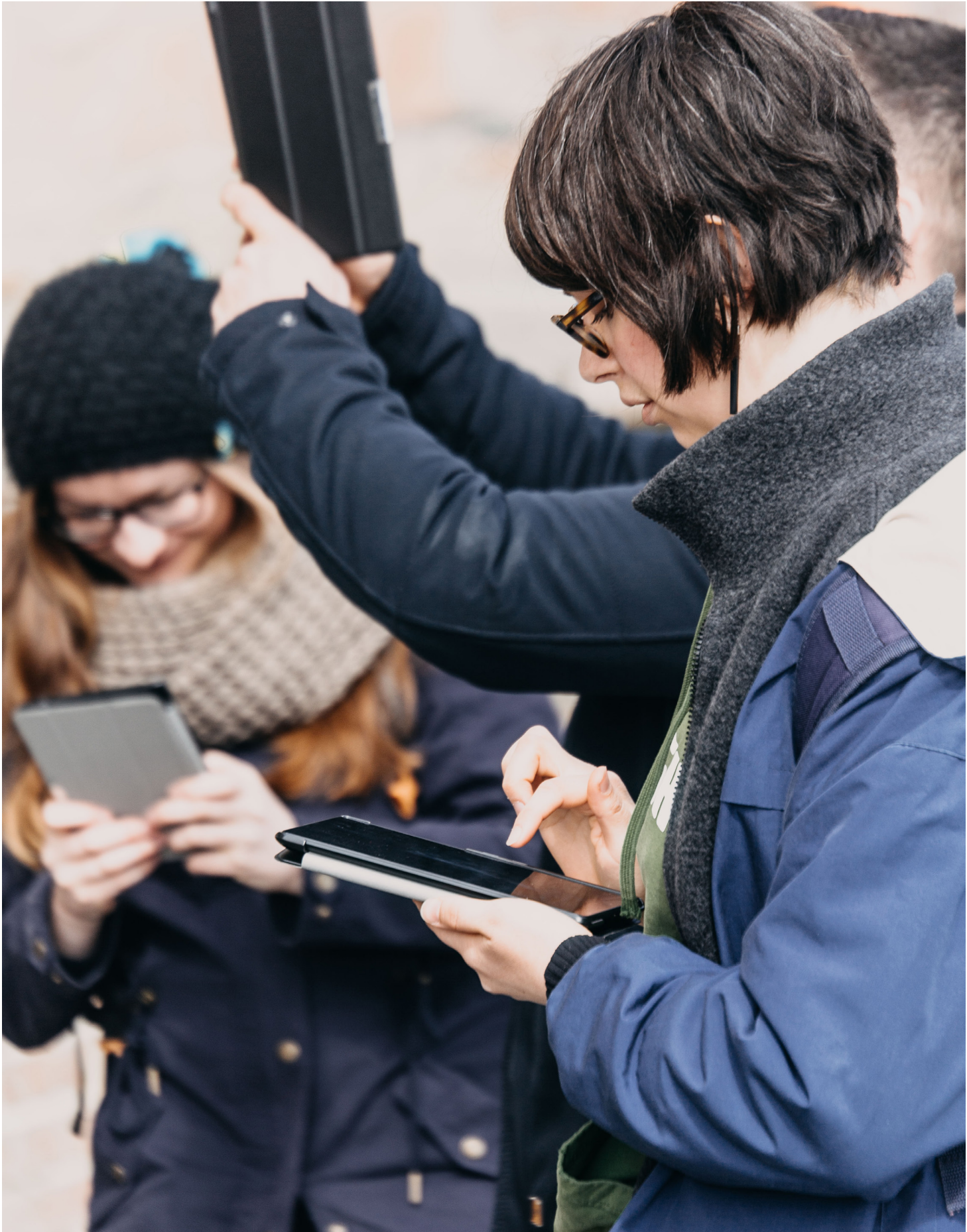
Kollektives Kartieren auf dem Campus. Foto: Daniel Munderlein