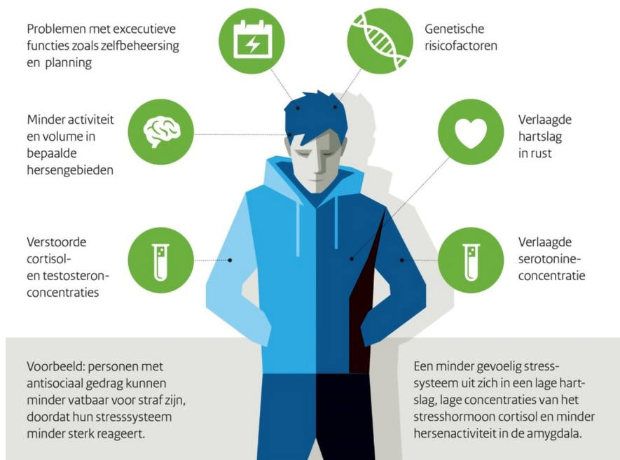
Figuur 1 Schematische samenvatting van de belangrijkste bevindingen op het gebied van neurowetenschappen en antisociaal gedrag

beschrijven we op welke manier het biologisch perspectief op antisociaal gedrag een aanvulling kan zijn voor de justitiële praktijk op het meer gangbare psychosociale perspectief.