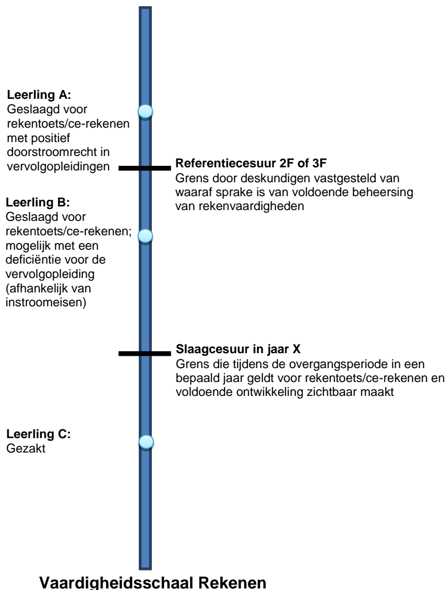
Figuur 1. Slaag/zak-beslissing afgezet tegen zowel de slaag- als de referentiecesuur.