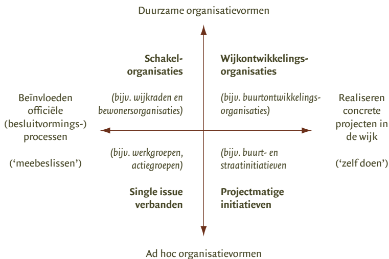
Figuur 3: Vier typen maatschappelijke verbanden van betrokken burgers in de wijk

De vier typen voortrekkers opereren niet solistisch, maar in maatschappelijke verbanden, en regelmatig ook in interactie met professionals en politici. Wanneer we focussen op de verschillende maatschappelijke verbanden of organisationele ‘habitats’ waarbinnen de vier typen voortrekkers regelmatig opereren zien we het volgende: