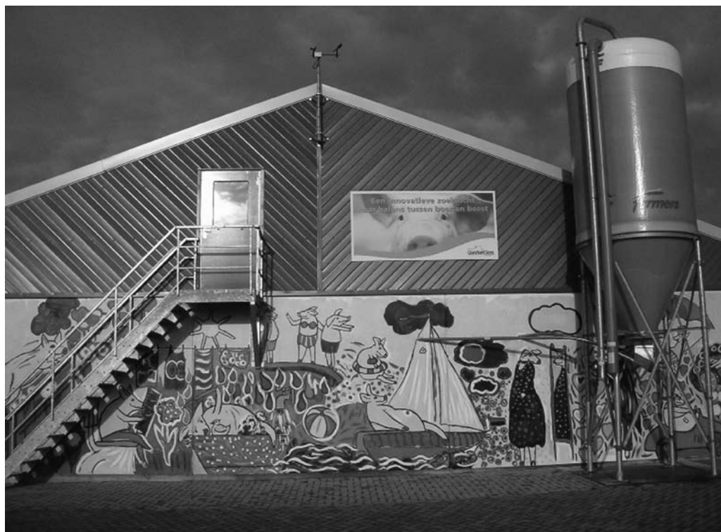
Figuur 1 Vooraanzicht stal.

Een betere situatie van de varkens dan in de bio-industrie, maar niet optimaal vanwege de ziekten die het dier in de buitenlucht kan oplopen. Behalve een terugkeer naar het paradijs, blijkt er ook een hemel te zijn. Een hemel op aarde waar varkens niet onderworpen zijn aan de wrede praktijken van de bio-industrie, kunnen wroeten en spelen, en vrij zullen zijn van ziekten. Door agrarische activiteiten samen te brengen en te stapelen ontstaat veel meer ruimte voor de varkens en kunnen zij Comfort Class gehouden worden.