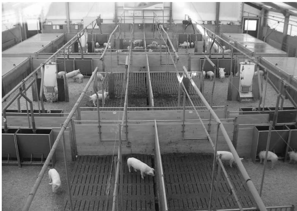
Figuur 2 Skybox-overzicht.

Wat vanuit de zichtlocatie niet direct zichtbaar is, is dat achter de indeling en gedragsmogelijkheden van de varkens een zorgvuldig opgezet schema zit van wat een varken tot een varken maakt. Varkens moeten rusten, eten en drinken, verkennen en samen kunnen zijn. Dit natuurlijke gedrag is vertaald in ontwerpeisen voor de stal (zie Tabel 1 en Tabel 2). De Comfort Class heeft het natuurlijke gedrag onder controle gebracht, niet door het te onderdrukken en onmogelijk te maken zoals in de bio-industrie, maar door het technologisch mogelijk te maken. De varkenshemel is een technologisch ontwerp.