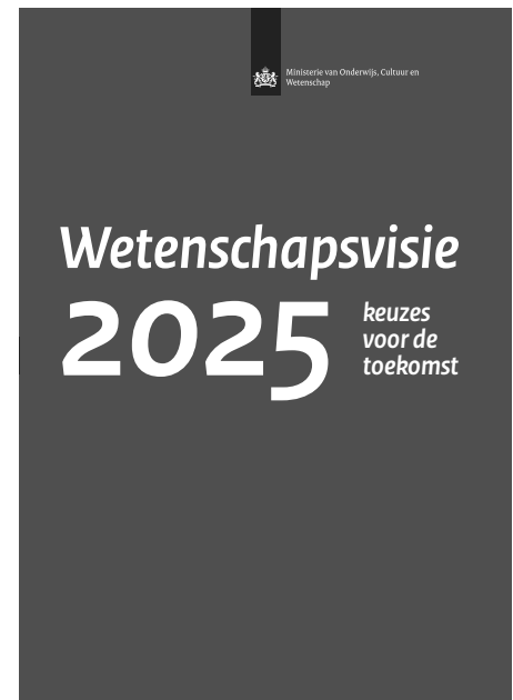
Wetenschapsvisie 2025 [1]

“De ERC-grants zijn inderdaad steeds groter geworden. Maar, en dat lees je ook in de strategienota van NWO, het persoonsgebonden vrije onderzoek wordt ook in Nederland nog steeds als de basis gezien van al het wetenschappelijk onderzoek. Het probleem is vooral dat er bezuinigd is op NWO en er binnen de gebieden weinig geld is, terwijl de aan vraagdruk enorm is toegenomen. We hopen