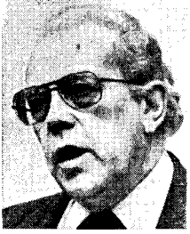
prof. dr. W. Albeda is minister van Sociale Zaken; daarvóór was hij rector van de Stichting Bedrijfskunde te Delft.

waarden? Ik denk dat het onvermijdelijk is dat wij zoeken naar politieke maatregelen, die de aanvaardbaarheid van het wat minder aantrekkelijke sociaal-economische en financiële beleid kunnen vergroten. De gedachten die destijds zijn ontwikkeld in het CDA-rapport 'Gespreide Verantwoordelijkheid' over de economische orde, die behoorlijk wat aandacht hebben gekregen in het ontwerp-verkiezingsprogramma, zullen de komende jaren politiek vertaald moeten worden in maatregelen die inderdaad de verantwoordelijkheden spreiden. Niet alleen wat betreft het loonbeleid, dus het decentraliseren van het loonoverleg naar lagere niveaus (liefst in de onderneming of althans zo dicht mogelijk bij de onderneming), maar ik denk ook aan het spreiden van verantwoordelijkheden met betrekking tot het economisch beleid, dus de zeggenschap over investeringen, zeker als het gaat over de zeggenschap over het geld dat beschikbaar komt als gevolg van inkomensmatiging.