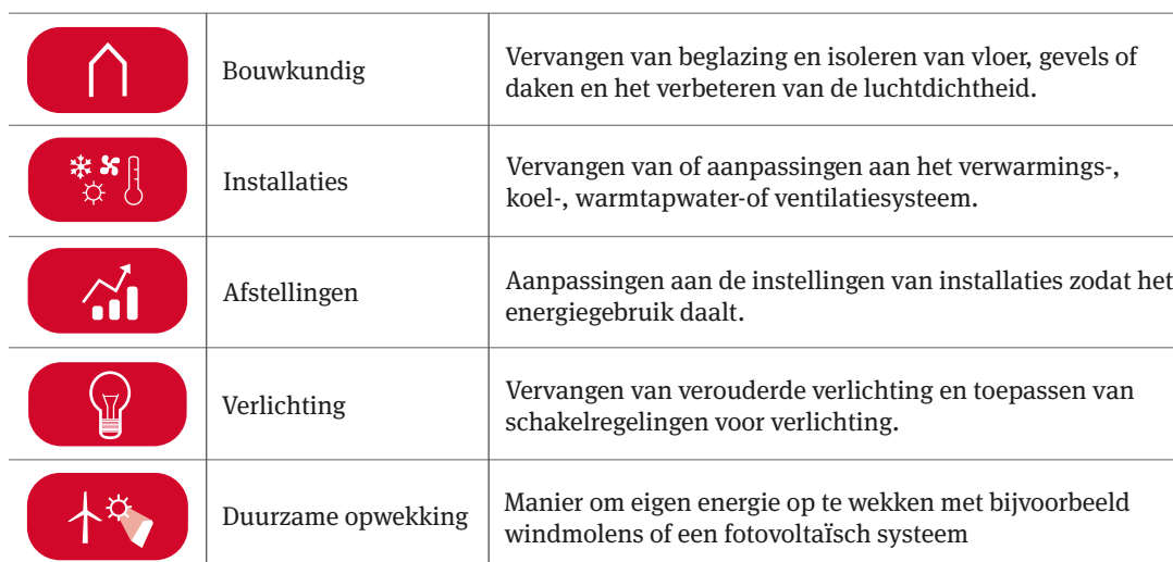
Tabel 1. Categorieën ETM's.

goedbeschermer een specialist heeft om uiteindelijk de ETM's toe te passen.