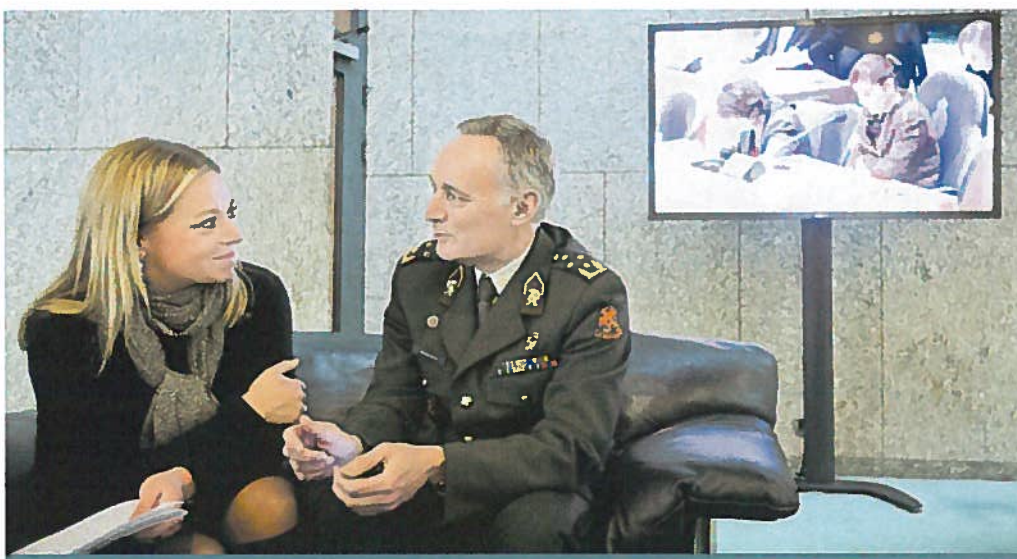
Minister van Defensie Jeanine Hennis-Plasschaert en Commandant der Strijdkrachten Generaal Tom Middendorp voor aanvang van het debat over de Missie in Mali.

De beslissing van het kabinet om militairen naar Mali te sturen, lag er al een tijdje. Daar komt nu, na twee lange dagen vergaderen, ook de brede steun van de Tweede Kamer bij. Het verlossende woord kwam gisteren aan het begin van de avond. Alleen de SP, PVV en PvdD, die vanaf het begin al kritisch waren, stemden tegen. In de komende twee jaar zullen ongeveer 370 militairen, enkele tientallen politiegagenten en burgers naar het Afrikaanse land afreizen. Zij zullen deel uitmaken van de VN-missie Minusma. Nederland is verantwoordelijk voor het opzetten van een inlichtingen netwerk – met name voor het verzamelen van informatie over extremistische moslim-groeperingen – in het onrustige noorden van Mali. De bijdrage van Nederland duurt in ieder geval tot 2015. Het akkoord van de Tweede Kamer kwam niet vanzelf. Diverse partijen bezwoeren herhaaldelijk 'niet op de stoel van de commandant der strijdkrachten' te willen zitten. Toch maakten zij zich grote zorgen over het ontbreken van transporthelikopters bij het Nederlandse deel van de missie. Minister Jeanine Hennis-Plasschaert (Defensie) wil die niet zelf meesturen, omdat ze volgens het leger niet noodzakelijk zijn. Daarnaast hangt er een fors prijskaartje van vijftig miljoen euro aan het twee jaar lang gebruiken van drie helikopters. Volgens haar zullen VN-bondgenoten voor de helikopters zorgen. Zo zorgt Frankrijk voor evacuatie van gewonden. In het debat van woensdag meldde de bewindsvrouw dat gesprekken daar-