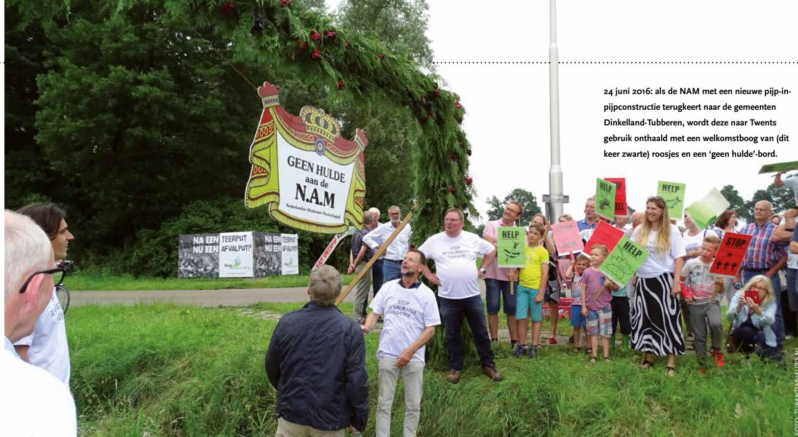
24 juni 2016: als de NAM met een nieuwe pijp-in- pijpconstructie terugkeert naar de gemeenten Dinkelland-Tubberen, wordt deze naar Twents gebruik onthaald met een welkomstboog van (dit keer zwarte) roosjes en een 'geen hulde'-bord.