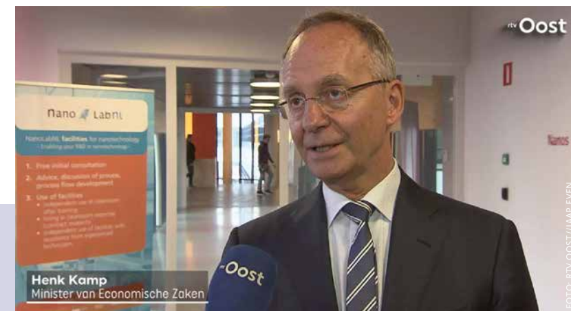
23 januari 2017: minister Kamp heeft zojuist het rapport van Stop Afvalwater Twente aanvaard en staat de pers te woord.

Bij consultatie en burgerparticipatie willen we dan ook meer aandacht bepleiten voor deze agendabepalende instanties en gremia. Als burgers zijn uitgesloten van de gremia die beslissen over wat ter discussie zal komen, kan alleen gebruik worden gemaakt van de kennis van burgers die het eens zijn met de gekozen voorstellen van de bestuurders. Burgerkennis blijft zo onderbenut en andere oplossingen voor stedelijke problematieken blijven buiten beeld. Een gemiste kans als we de ecologische problemen van de huidige stedelijke ontwikkeling op een slimme en sociale manier willen oplossen.