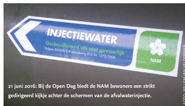
21 juni 2016: Bij de Open Dag biedt de NAM bewoners een strikt gedirigeerd kijkje achter de schermen van de afvalwaterinjectie.

Terwijl bestuurders steeds meer leunen op expertkennis, lijken ze de inbreng van burgers en hun kennis te willen beperken tot