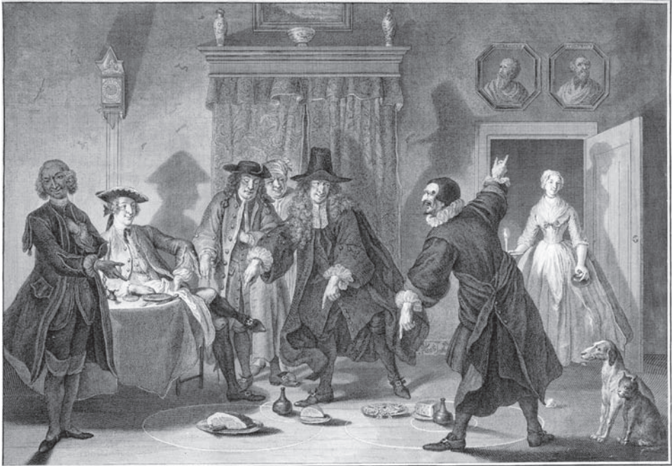
Fig. 1: Gravure van het negentiende toneel van Pieter Langendijks De wiskunstenars door Pieter Tanjé, naar een pastel van Cornelis Troost (1741). De wiskundigen Raasbollius en Urinaal twisten over de loop van de planeten, waarbij ze de stelsels van Ptolemaeus en Copernicus met etenswaren op de grond hebben uitgebeeld.